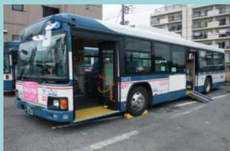
ノンステップバス

補助率：1／4又は補助対象経費と通常車両価格の差額の1／2のいずれか低い方（上限140万円）