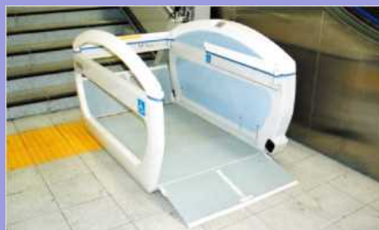
車椅子用階段昇降機