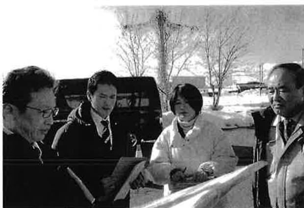
・弘前市建設課による市除排雪状況の説明