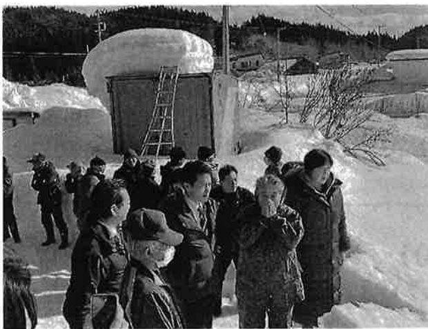
・パイプハウス倒壊現場での被災農家さんによる説明(倒壊ハウスは1基400万)