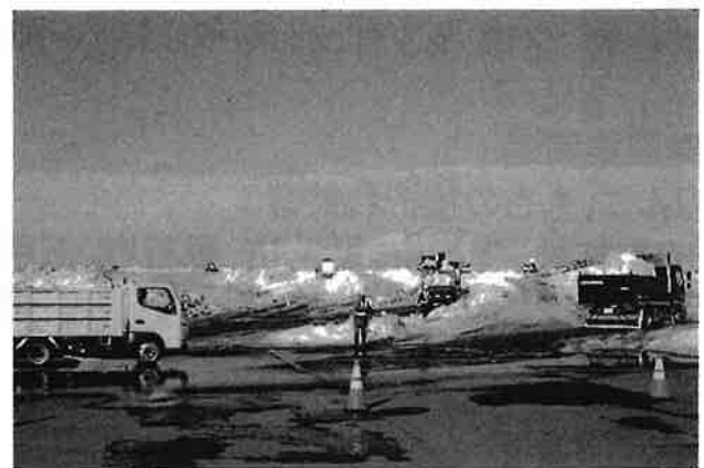
・堀越雪置場視察(1日2~3000台)