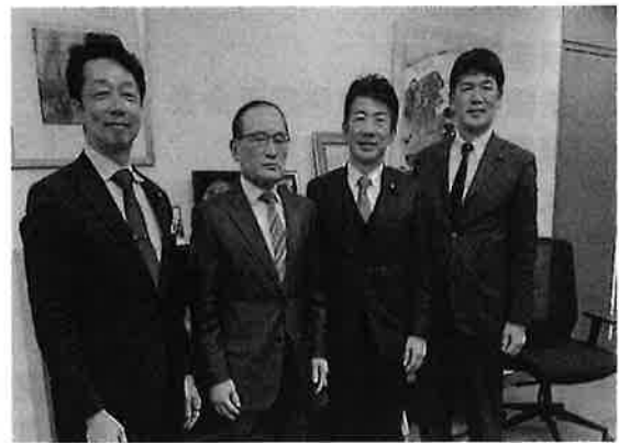
ウィ・ソンラク「共に民主党」議員