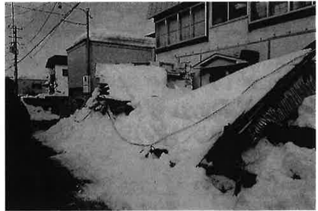
・岡造道町内崩落家屋の現状視察