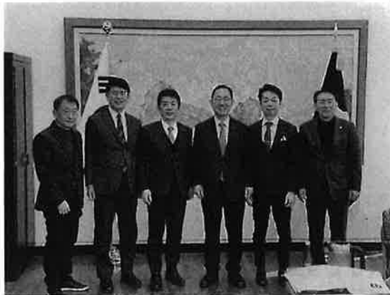
チュ・ホヨン「国民の力」議員・国会副議長