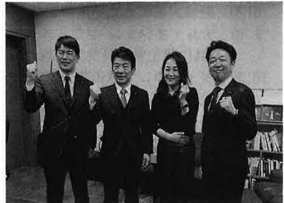
イ・ジェジョン「共に民主党」議員